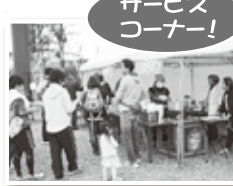
うきさと鍋のふるまい (うきさとむら運営協議会)