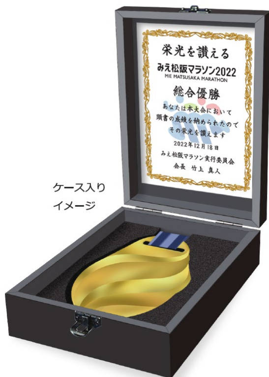
ケース入り イメージ